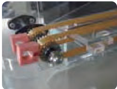
●우레탄 타이밍 벨트